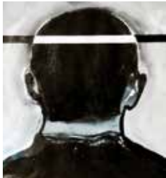
“El espectador” ARTEPOLI

Una trobada d'artistes internacionals, principalment llatinoamericans, que utilitzen l'art com a eina de comunicació, expressant les seves preocupacions i visions del món. En contextos desafiants, les seves obres transcendeixen allò decoratiu per connectar amb el públic. L'exposició convida a una experiència que va més enllà de la contemplació passiva, convertint l'espectador en protagonista d'un diàleg amb les obres seleccionades de la revista Artepoli.