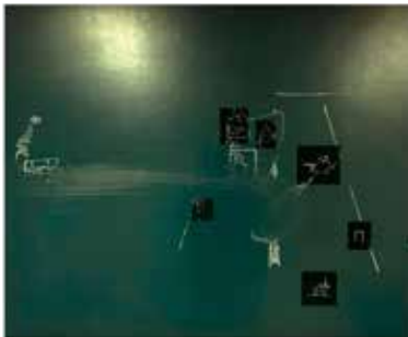
Fotografia de la Cia